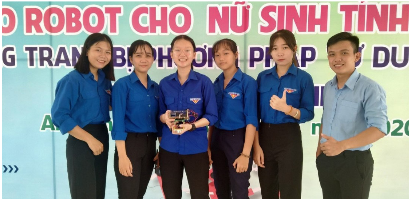
Các học viên nữ tham gia Cuộc thi Robocon ở trường Cao đẳng nghề An Giang

Sự bùng phát dịch COVID-19 cũng đã làm thay đổi phương thức truyền thông và tuyển sinh. Thay cho những sự kiện tuyển sinh trực tiếp, nhiều hình thức quảng bá và tiếp thị số đã được áp dụng, giúp các trường đối tác tiếp cận học viên và chia sẻ thông tin tuyển sinh hiệu quả. Chương trình hợp tác với các cơ sở GDNN đối tác để nâng cao năng lực sử dụng các phương pháp truyền thông số trên mạng xã hội và phát sóng việc khai thác các kênh truyền thông khác nhau trong việc tiếp cận các nhóm đối tượng khác nhau.