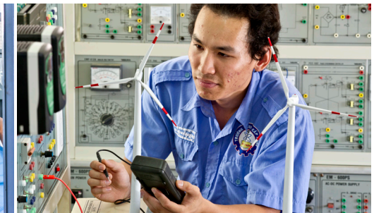
Practical training of Mechatronics at Ninh Thuan Vocational College