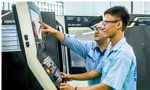
Metal Cutting trainee in the CNC workshop at LILIMA 2 International Technology College