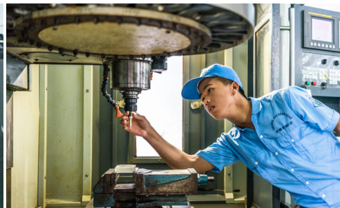
Metal Cutting trainee at College of Machinery and Irrigation